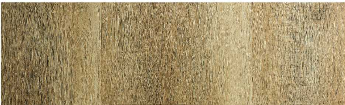
04 ASPC7CW » Cottonwood / 卡頓 1220mmX181mmX5.5mm