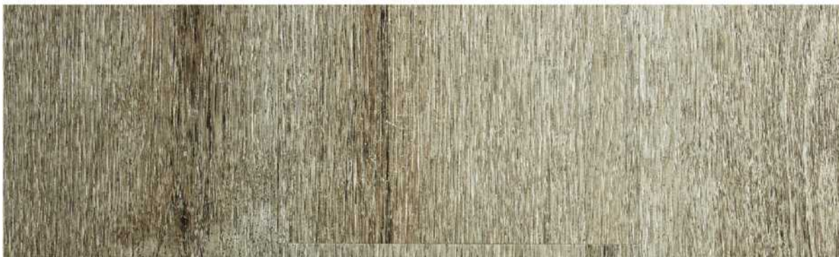
07 ASPC7RH » Rio Hondo / 本多河 1220mmX181mmX5.5mm