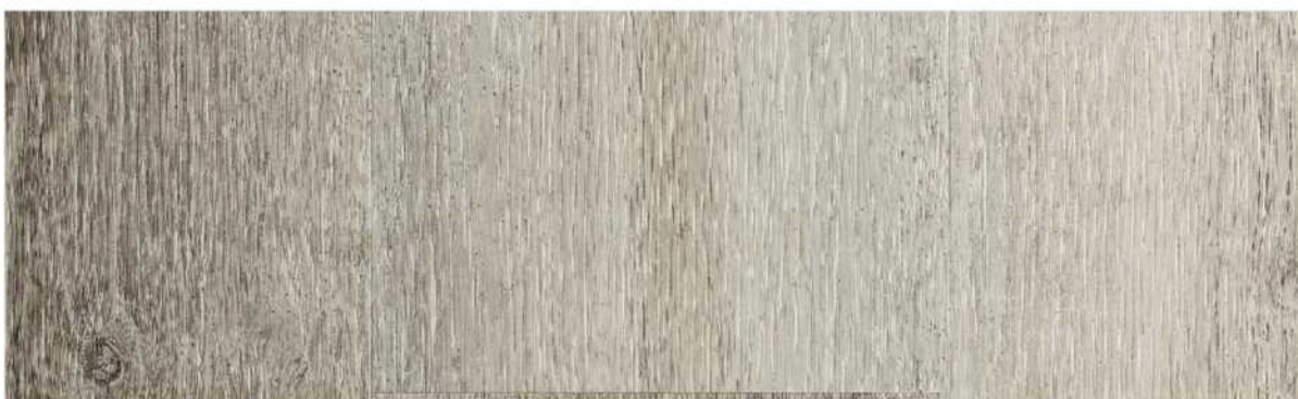
08 ASPC7SW » Sweetwater / 斯威沃特 1220mmX181mmX5.5mm