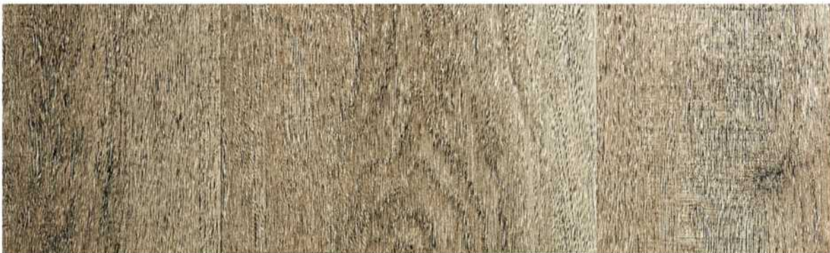
03 ASPC7CB » Calabastas / 卡拉巴薩 1220mmX181mmX5.5mm