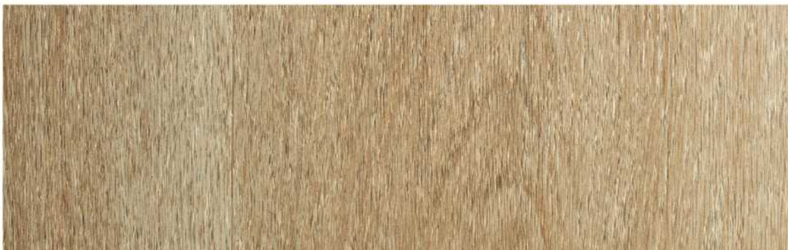
11 ASPC9KN » Keene / 基恩 1524mmX228mmX5.5mm