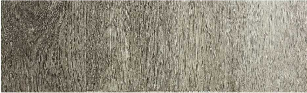
01 ASPC7AG » Amargosa / 阿馬戈薩 1220mmX181mmX5.5mm