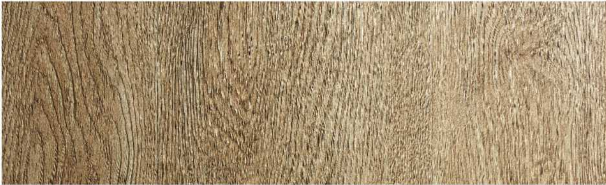
02 ASPC7BL » Ballona / 巴洛內 1220mmX181mmX5.5mm