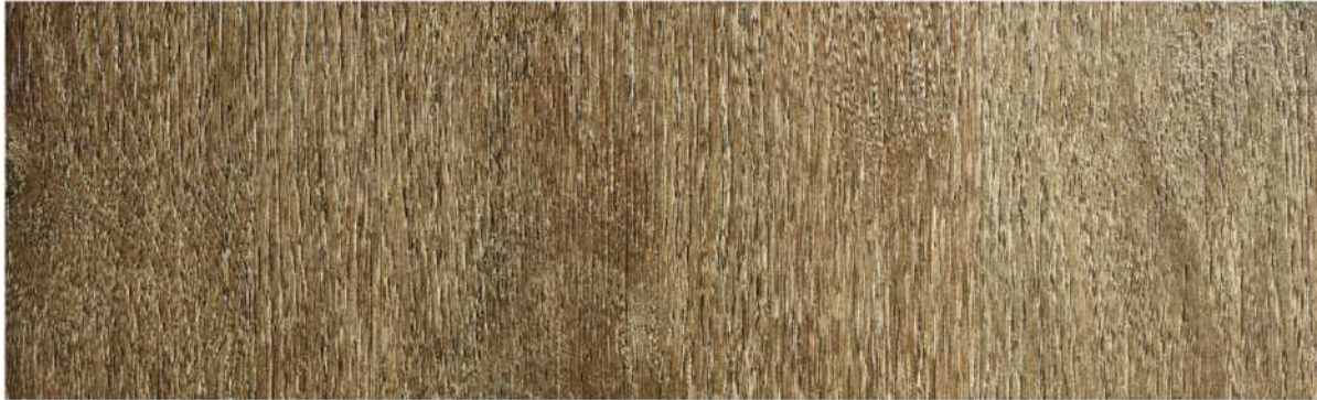
05 ASPC7ER » Estrella River / 埃斯特拉 1220mmX181mmX5.5mm