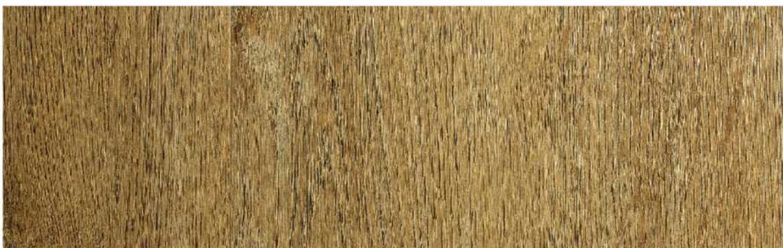
12 ASPC9CL » Cortland / 科特蘭 1524mmX228mmX5.5mm