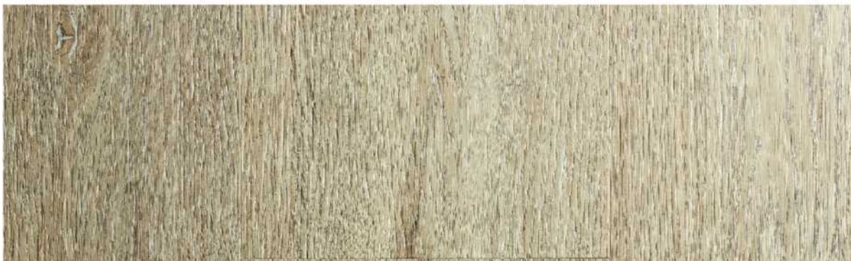
06 ASPC7MC » Morro Creek / 莫羅溪 1220mmX181mmX5.5mm