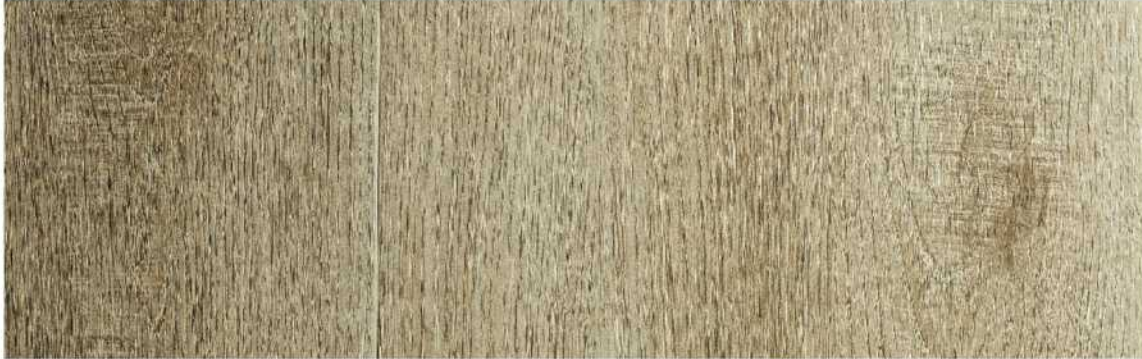
09 ASPC9RC » Redwood City / 紅木城 1524mmX228mmX5.5mm