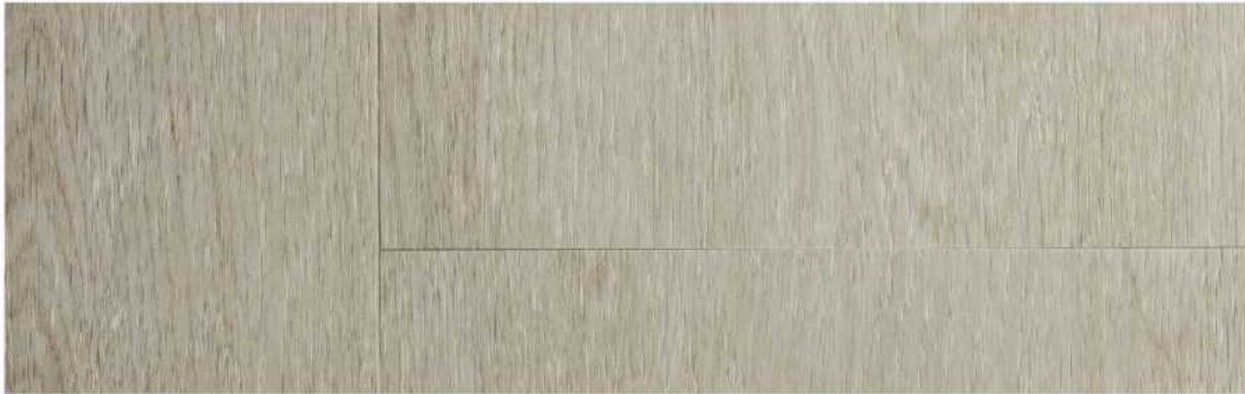
10 ASPC9NW » Norwich / 諾威奇 1524mmX228mmX5.5mm