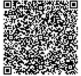
01 VSPC7SB » San Becinto / 聖貝尼托 1524mmx182mmx5.5mm