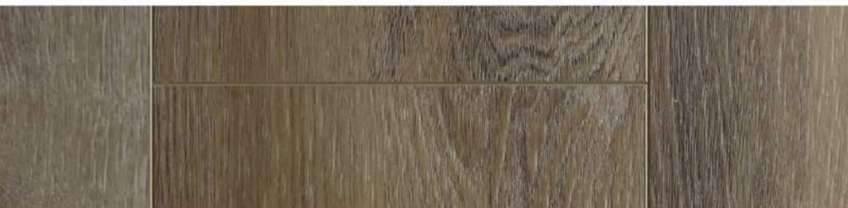
08 VSPC9SP » Sandpoint / 桑德波因特 1524mm x 228mm x 5.5mm