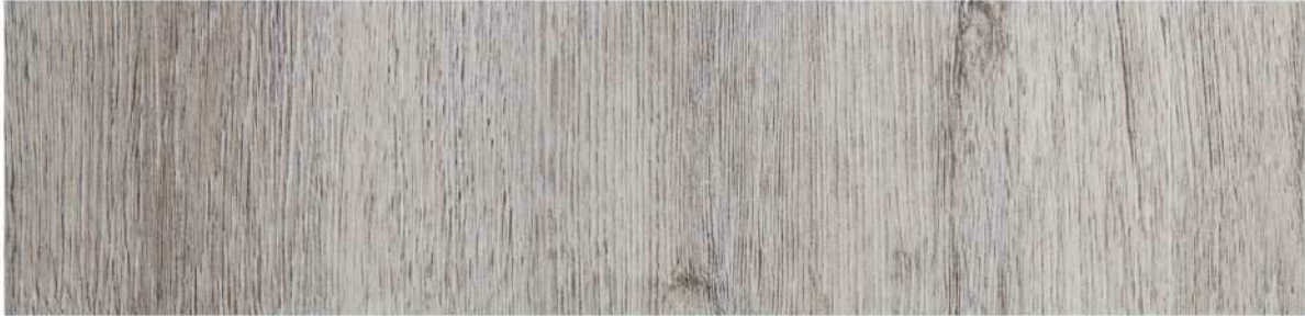
09 VSPC9SH » St.Helena / 聖海倫娜 1524mmX228mmX5.5mm