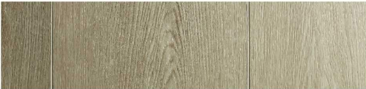
11 VSPC9ML » Maili / 麥莉 1524mmX228mmX5.5mm