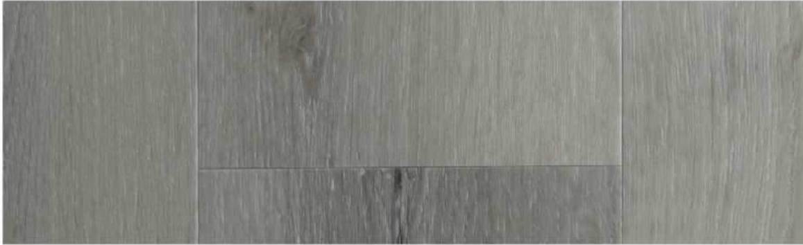
05 VSPC7DL » Duluth / 德魯斯 1524mm x 182mm x 5.5mm