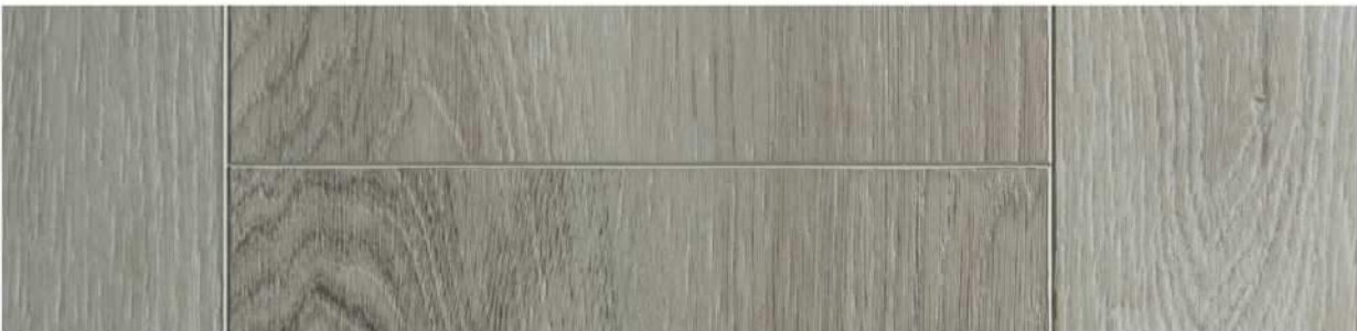
07 VSPC9GT » Georgetown / 喬治城 1524mm x 228mm x 5.5mm