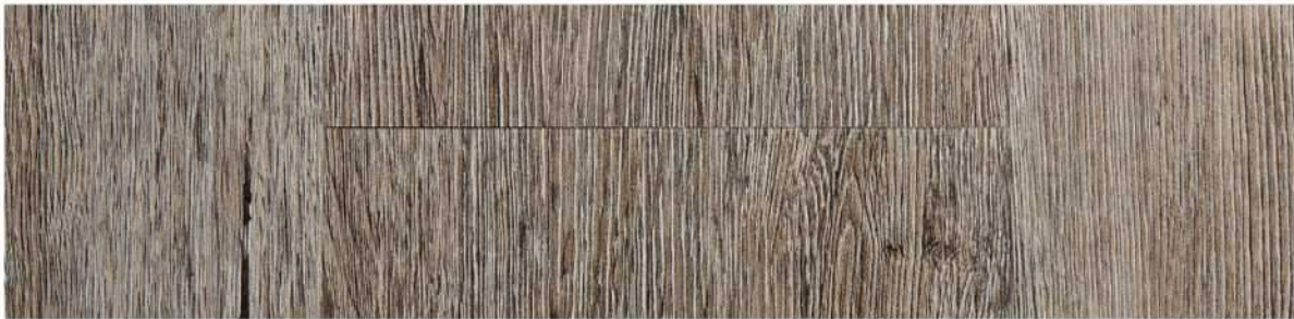
10 VSPC9RF » Rutherford / 羅斯福 1524mmX228mmX5.5mm