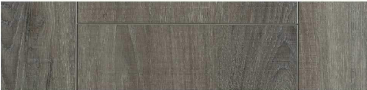
06 VSPC9CC » Conway Creek / 康威溪 1524mm x 228mm x 5.5mm