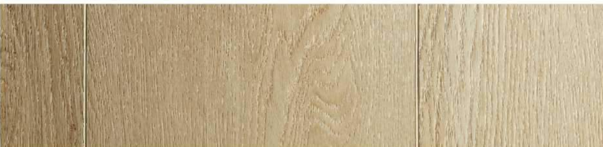
12 VSPC9WL » Wailea / 薇利亞 1524mmX228mmX5.5mm