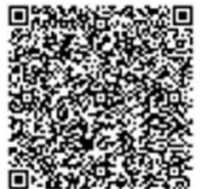
04 VSPC7MV » Mt Verde / 蒙特維多 1524mmx182mmx5.5mm